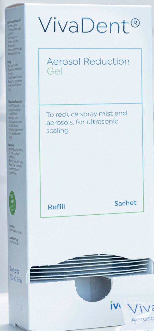
Ultraschallscaler mit Aerosol Reduction Gel